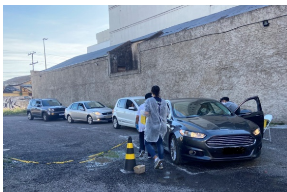
Figura 1: Drive Thru em funcionamento

RESULTADOS: Durante o período de campanha, foram aplicadas 6.614 doses de vacina quadrivalente contra a influenza. Destas, 57% foram aplicadas em Porto Alegre, em sua grande maioria, utilizando o sistema Drive Thru, oferecido pela operadora a seus beneficiários, proporcionando maior segurança, devido à pandemia do Coronavírus. 76 cidades foram abrangidas pela campanha 2020, sendo 74 no estado do Rio Grande do Sul, 01 em Santa Catarina e 01 no Paraná. O total de doses aplicadas, correspondeu à 93,43% da